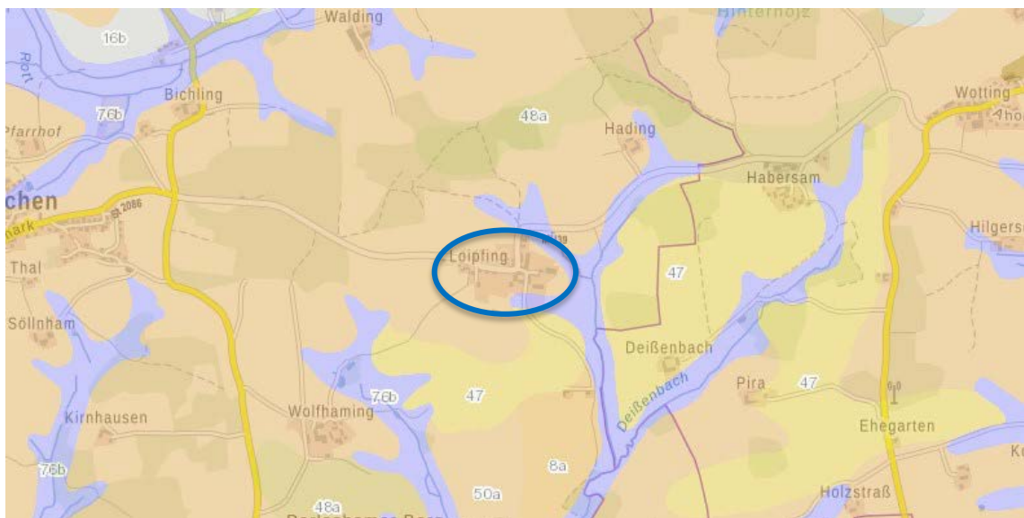
ÜBK25-Ausschnitt aus dem Umwelt-Atlas des Bayerischen Landesamts für Umwelt (LfU).

Gemäß der Übersichtsbodenkarte des Bayerischen Landesamts für Umwelt (LfU) im Maßstab 1:25.000 befindet sich das Planungsgebiet auf den nachfolgend beschriebenen Legendeneinheiten.