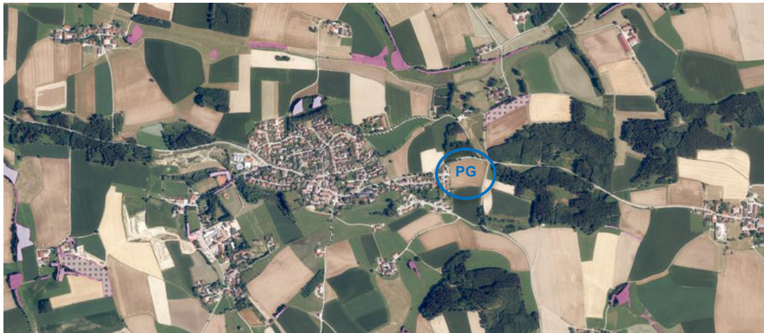
Luftbildausschnitt von Oberbergkirchen aus FIS-Natur Online des LfU mit Daten der Biotopkartierung (rot) und Planungsgebiet (PG, blau), Geobasisdaten: © Bayerische Vermessungsverwaltung