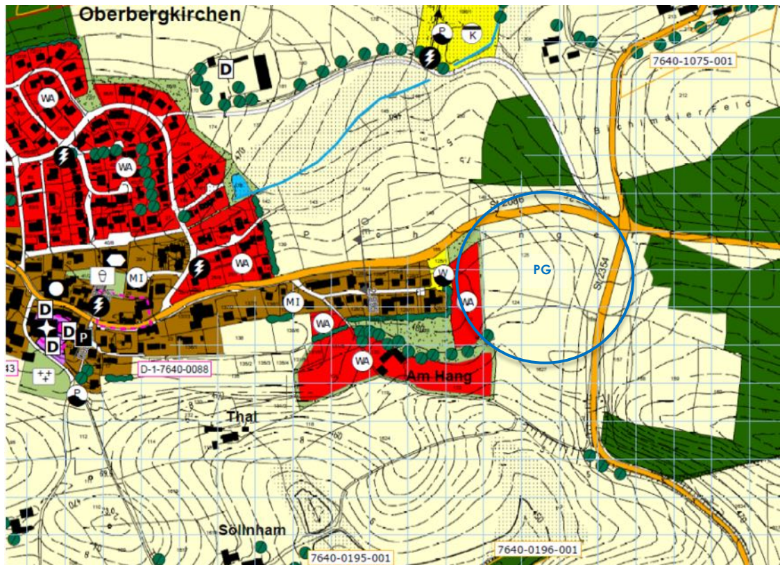
Ausschnitt aus dem rechtsgültigen Flächennutzungsplan vom 05.06.2014 mit Planungsgebiet (PG)

Im genehmigten Flächennutzungsplan mit integriertem Landschaftsplan ist das Planungsgebiet derzeit als Fläche für die Landwirtschaft dargestellt. Westlich der Planung liegen als Allgemeines Wohngebiet (WA) ausgewiesene Flächen, die im Zuge der Bebauungspläne „Wohngebiet Am Hang“ und „Wohngebiet Am Hang II“ beplant wurden. Zudem sind Sonstige Grünflächen zwischen den bestehenden Allgemeinen Wohngebieten und der vorliegenden Planung dargestellt. An der St 2086 befindet sich eine Fläche für Versorgungsanlagen Wasser (gemeindlicher Wasserbehälter) zwischen bestehendem Allgemeinem Wohngebiet und Mischgebiet. Östlich der vorliegenden Planung sowie der St 2354 befinden sich Flächen für die Landwirtschaft und für Wald.