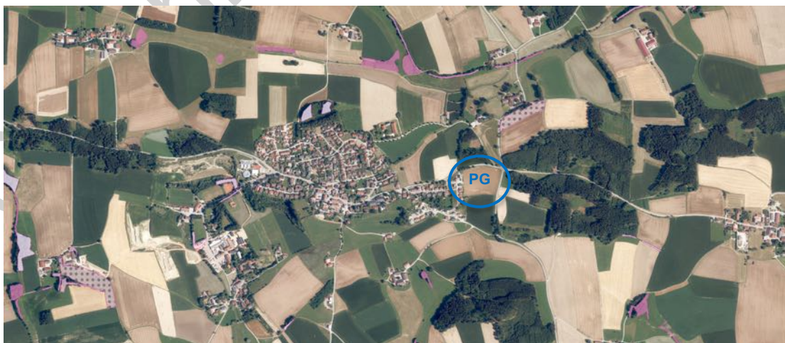
Luftbildausschnitt von Oberbergkirchen aus FIS-Natur Online des LfU mit Daten der Biotopkartierung (rot) und Planungsgebiet (PG, blau), Geobasisdaten: © Bayerische Vermessungsverwaltung