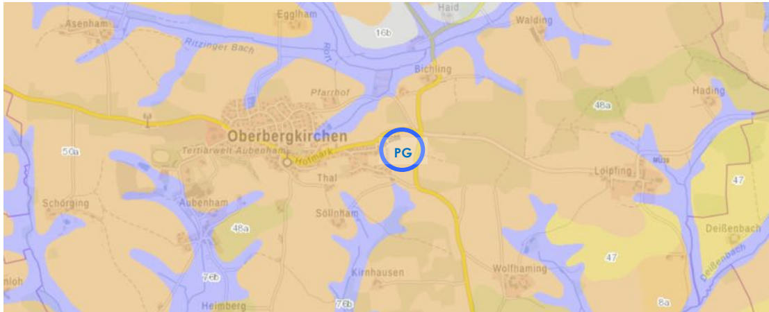
Abbildung des ÜBK25-Ausschnitts aus dem Umwelt-Atlas des Bayerischen Landesamts für Umwelt

Gemäß der Übersichtsbodenkarte des Bayerischen Landesamts für Umwelt (LfU) im Maßstab 1:25.000 befindet sich das Planungsgebiet auf den nachfolgend beschriebenen Legendeneinheiten (siehe nachfolgende Tabelle).